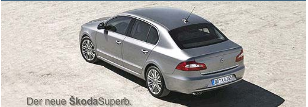
Der neue Škoda Superb.

Škoda Auto präsentiert auf dem Genfer Automobilsalon 2008 den Nachfolger des Topmodells der Traditionsmarke aus Tschechien – den neuen Škoda Superb. Die zweite Generation der eleganten Limousine knüpft unter anderem mit einem großzügigen Raumangebot und zahlreichen cleveren Detaillösungen an die Werte ihres Vorgängers an.